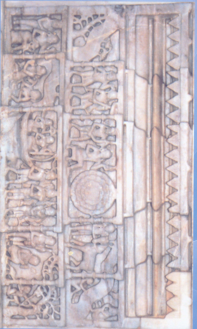
समलीविहारतीर्थ तथा अक्षावबोधना प्रसंगीने कंडारतुं प्राचीन शिल्प (खम्भात-शैल मन्दिर)