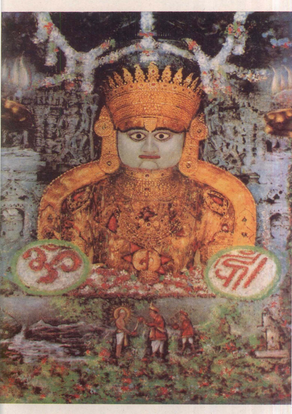
शतुंष्ठय तीर्थाधिराष्ठ श्री आहिश्वर भगवान Jain Education International For Private & Personal Use Only www.jai