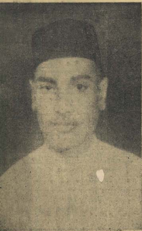
तंत्री : पणित श्रीलदास डेसरीयंज संघनी