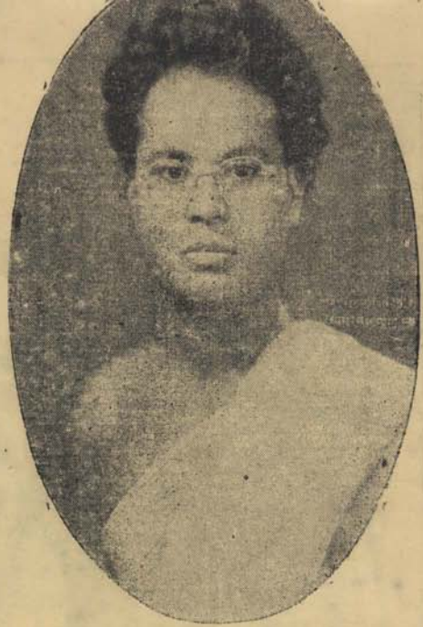
प्रेमक : साहित्यभूषण मुनिश्री इस्तुरसागरल