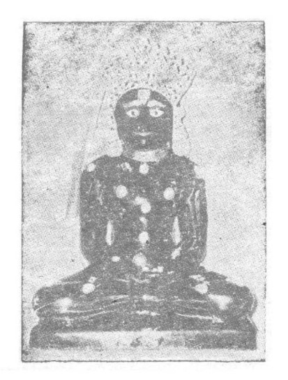
ચીત્ય પરિપાટી ગારેલ − ૧૯/૯/૯૦ આસા સુદ−૧ ખુધવાર પૃણ્યું હુતિ -૨૪/૯/૯૦ આસા સુદ-૫ સામવાર