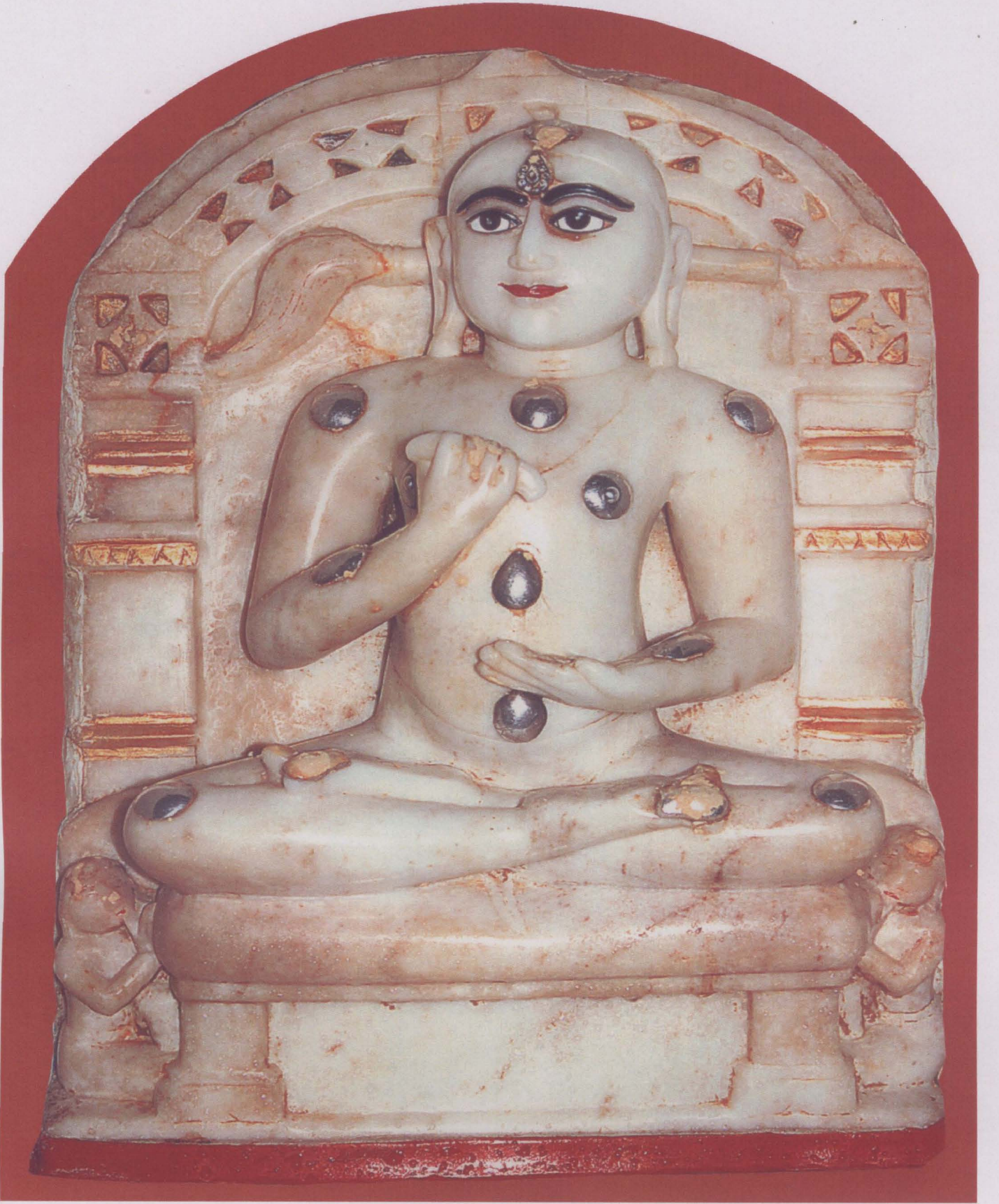
વિ.સં. ૧૨૫૭માં પ્રતિષ્ઠિત શ્રીહેમચંદ્રાચાર્યની પ્રતિમા - ઘંધુકા