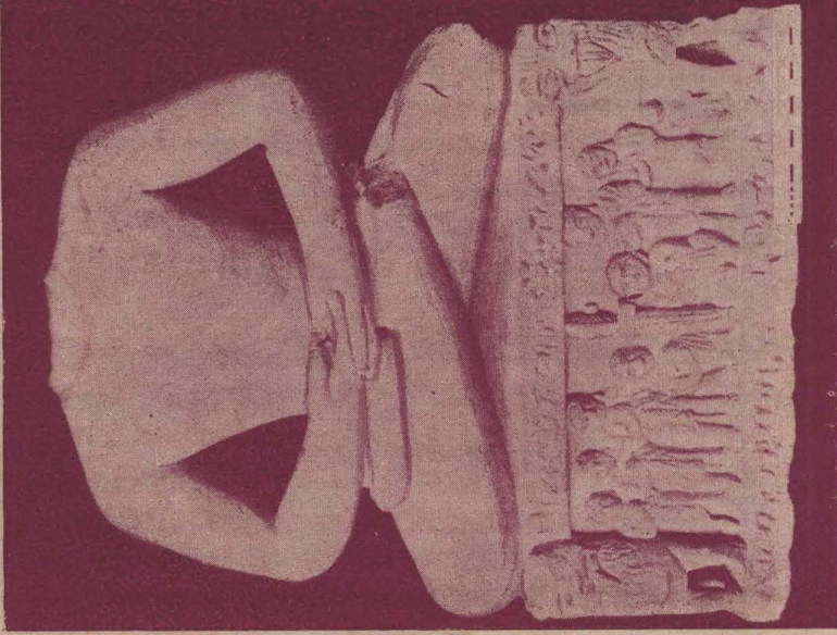
शिवालेभ सखित-साधुञ्चोतो। परिचय आपती प्रभु महावीरनी भूति