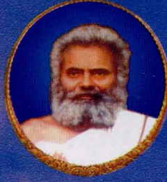
શાસનસમ્રાટ્ પરમપૂજ્ય આચાર્યદેવ શ્રી વિજય નેમિસૂરીશ્વરજી મ. સા.