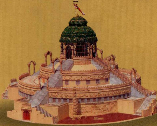
श्री १०८ जैन तीर्थ दर्शन ललपन-समवसरण महामंदिर - पालीताला