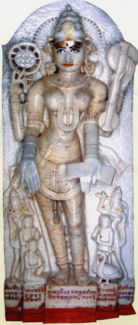
શ્રી સરસ્વતી દેવી (રાંતેજ તીર્થ)

યદુન્મીલનશક્ત્યેવ જગદુન્મીલતિ ક્ષણાત્ । સ્વાત્માયતન વિશ્રાન્તામ્ તામ્ વન્દે પ્રતિભાં શિવામ્ ॥