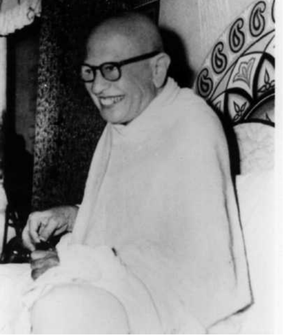
परम पूज्य आत्मज्ञसंत श्री ज्ञानशुभाभी