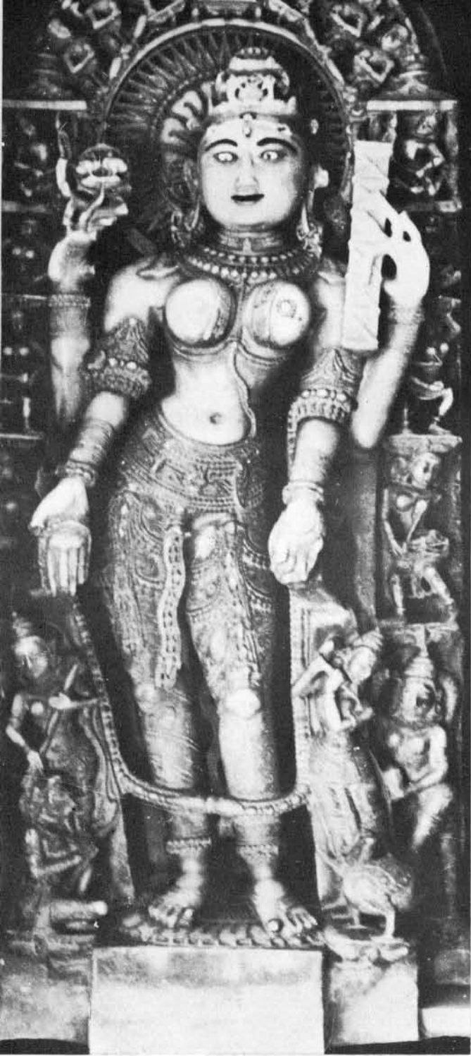
જૈન સરસ્વતી પ્રતિમા, સેવાડી (રાજસ્થાન)