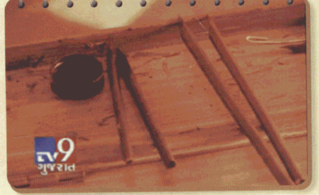
અહિંસક બરુની કલમ આવી હોય છે.