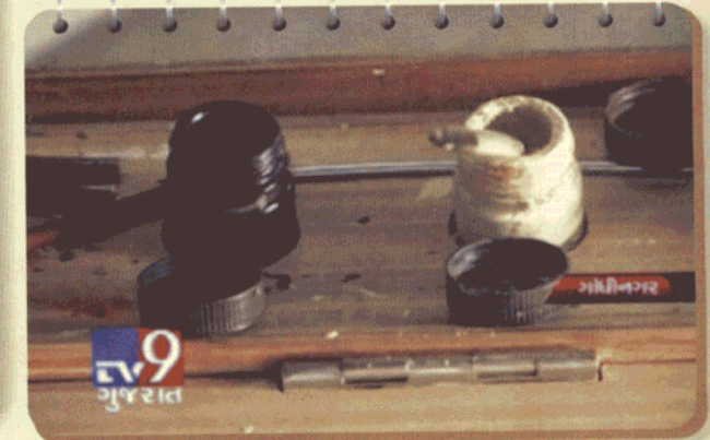
આર્ય સંસ્કાર શાળામાં બાળકો જાતે શાહી બનાવે છે.