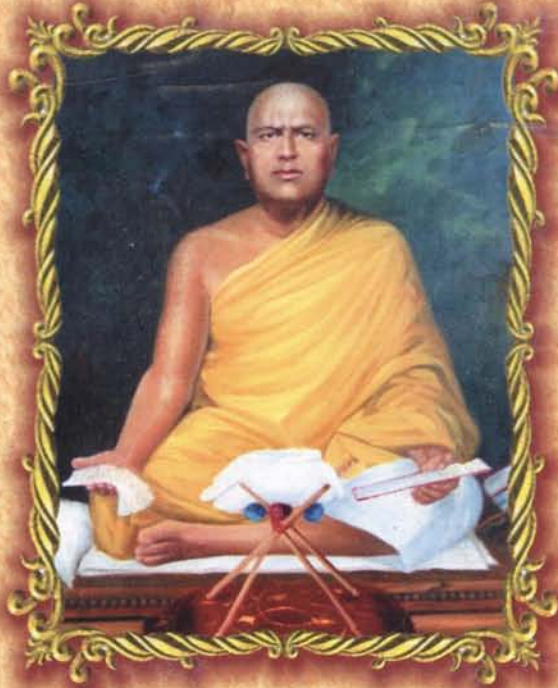
प.पू. पंजाबदेशोद्धारक-आचार्य- श्रीमद्विजयानंदसूरि म. ( पू. आत्मारामजी म. ) ।