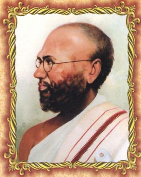
प.पू. समतासागर-पंन्यास- श्रीपद्मविजयगणिवराः ।