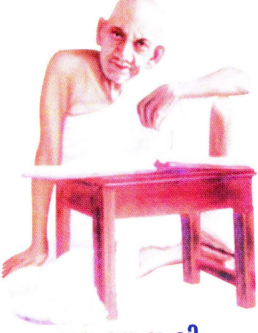
પ.પૂ.આ.ભ.શ્રી પ્રેમસૂરીશ્વરજી મહારાજ

અનેકાંતમર્મજ્ઞ, કર્મસાહિત્યનિષ્ણાત, સચ્ચારિત્રચૂડામણિ, શિદ્ધાંતમહોદધિ, સહસ્રાધિક શ્રમણસમુદાય ગુરુમૈયા, પરમપૂજ્ય આચાર્યભગવંત