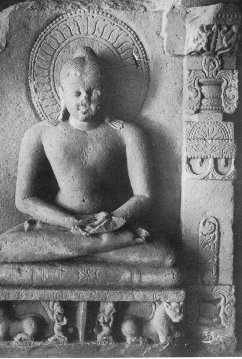
૩. ગોપગિરિ, કિલ્લાની આદિનાથની પ્રતિમા ત્રાય: ૮મી શતાબ્દા ત્રીજું ચરણ.