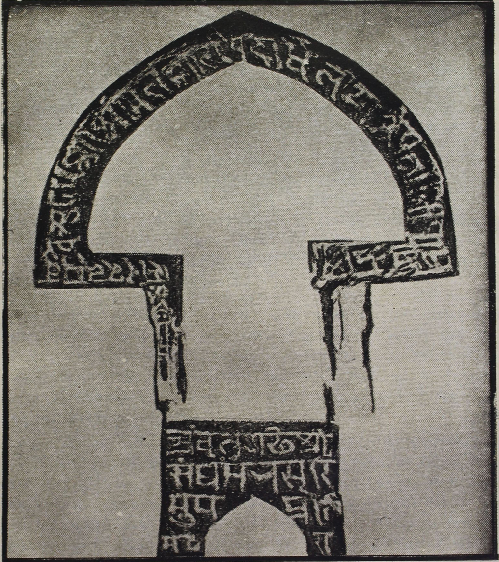
અચલગચ્છની સૌથી પ્રાચીન પ્રાપ્ય ધાતુમૂર્તિ (સં. ૧૨૩૫)ના લેખની પેન્સીલ ઘસીને લીધેલી છાપ. જીએ. લેખાંક ૧૦૬૨ (મોઢેરા)