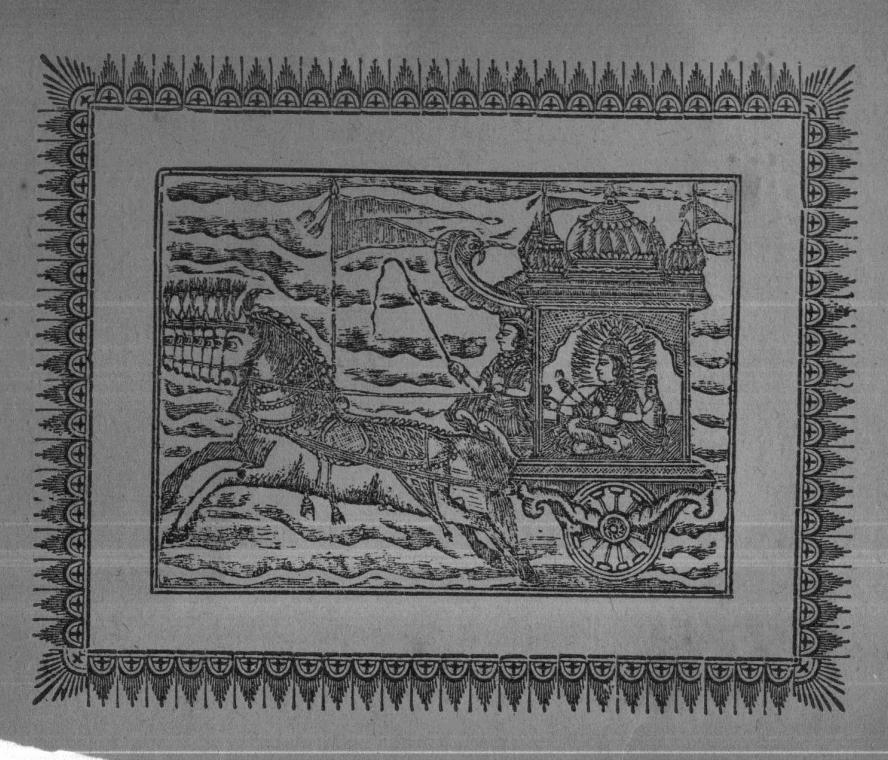
For Private and Personal Use Only