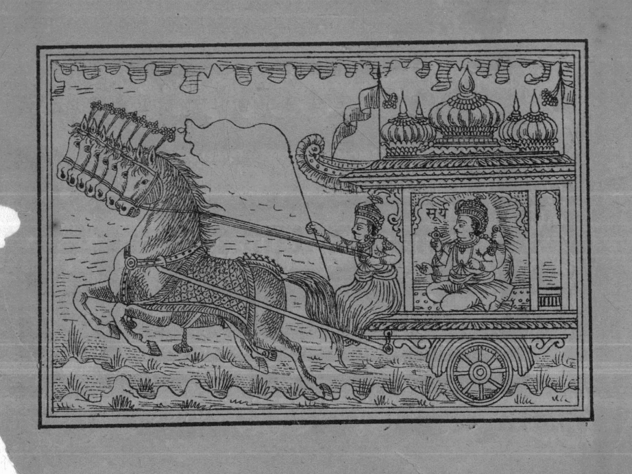
For Private and Personal Use Only