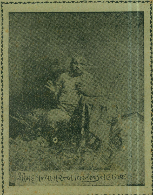
श्रीमद् पन्थासुरेण विरच्येणमलारण्य.