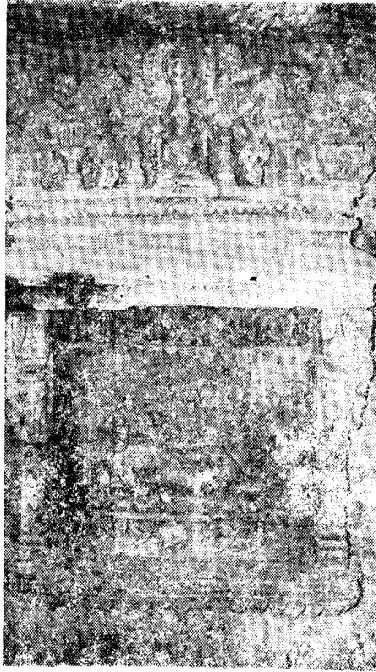
[ચિત્ર ૧ : પા. ૧૧]