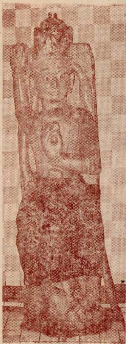
[ચિત્ર ૩ : પા. ૧૪]