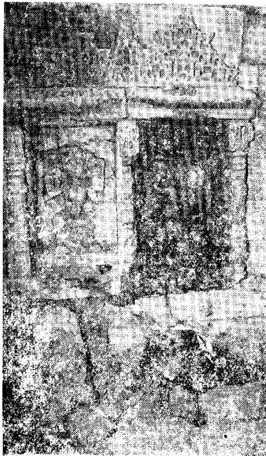
[ચિત્ર ૨ : પા. ૧૨]