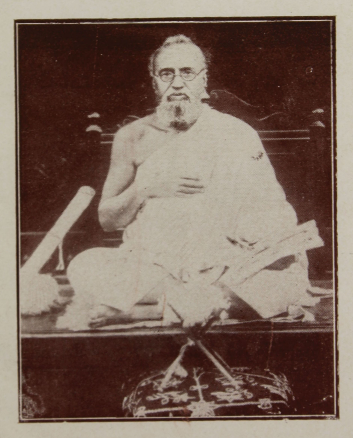
આચાર્ય श्रीम६ विજयवद्स सस्रिक्छ भढ़ाराक