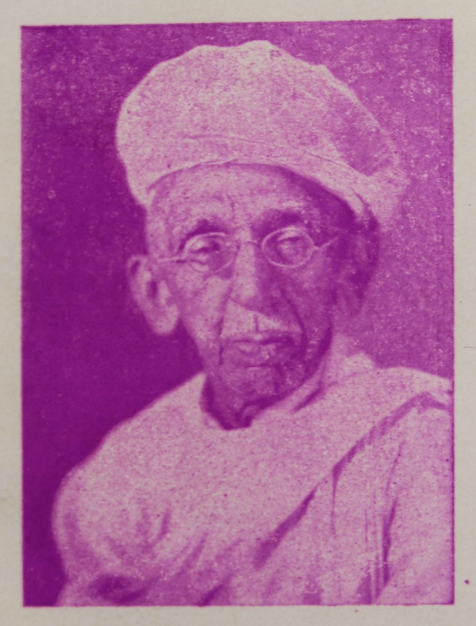
स्वर्शस्य : श्री इ'वर्ष्टलाइ आख्'इल