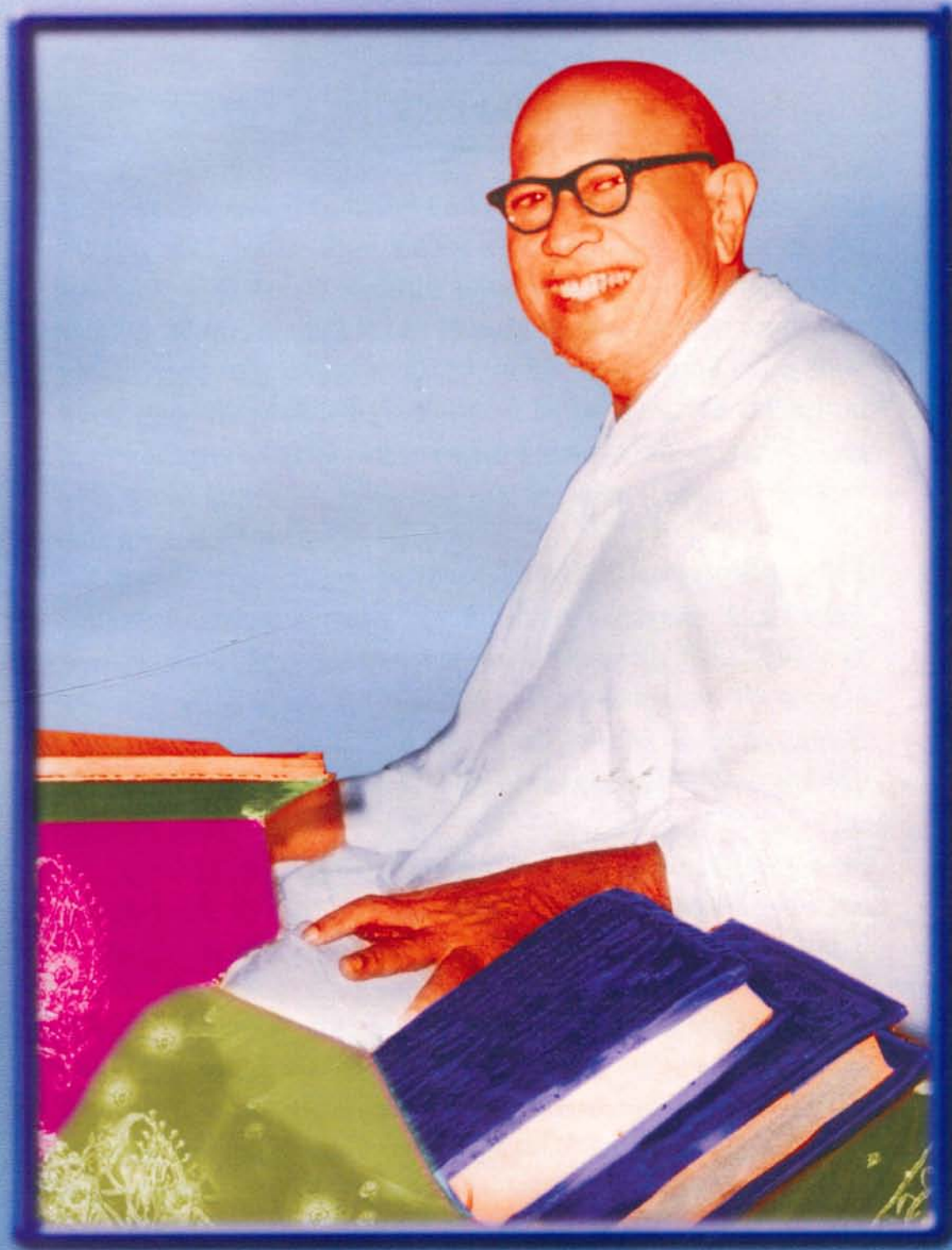
પરમોપકારી પૂજ્ય ગુરુદેવ શ્રી કાળજીસ્વામી