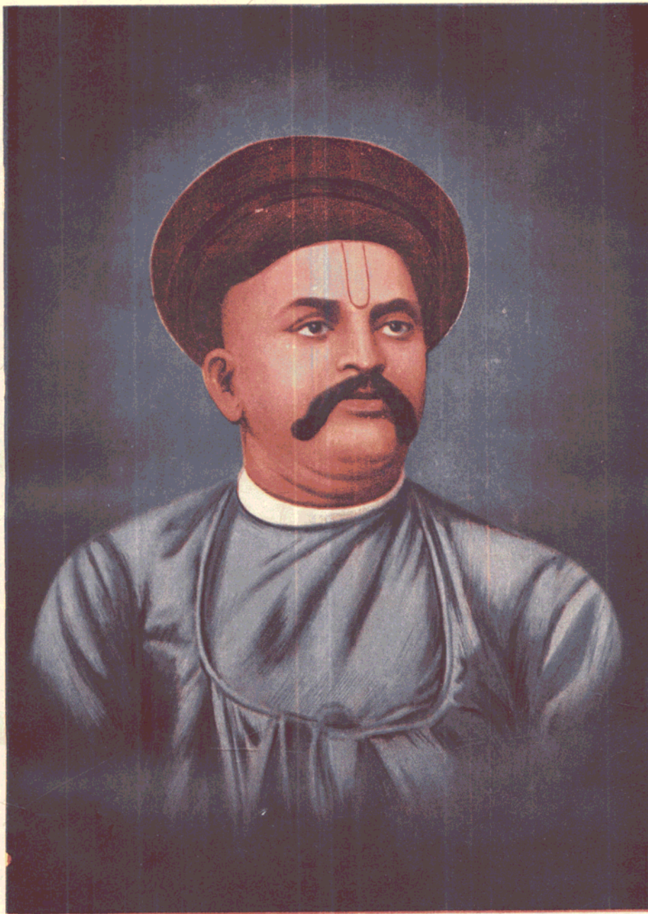
PRIN. VAMAN SHIVRAM APTE, [ 1858–1892 ]