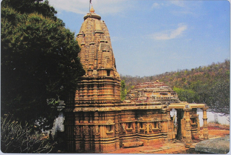
प्रभु महावीर जन्म स्थान मन्दिर - क्षत्रियकुण्ड

TITLE CODE : GUJ MUL 00578. SHRUTSAGAR (MONTHLY). POSTAL AT. GANDHINAGAR. ON 15TH OF EVERY MONTH. PRICE : RS. 15/- DATE OF PUBLICATION JAN- 2016