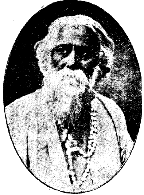
‘ચિત્રાંગદા’—જગવિખ્યાત રસનાટિકાના મહાન લેખક—કવિવર રવીન્દ્રનાથ ટાગોર

‘આપણી કીડા એ, પ્રાણનાથ ! એવી જ છે. તમે સૌંદર્યના વિહુદ્ગતિ આત્માની પાછળ, તમારી પાસે છે તે એક એક બાણ ફેંકતા, ધાઓ છો, છતાં આ ગદુઈ હરણુ સદાય મુક્ત અને અરપૃષ્ટ દોડ્યા કરે છે.....’